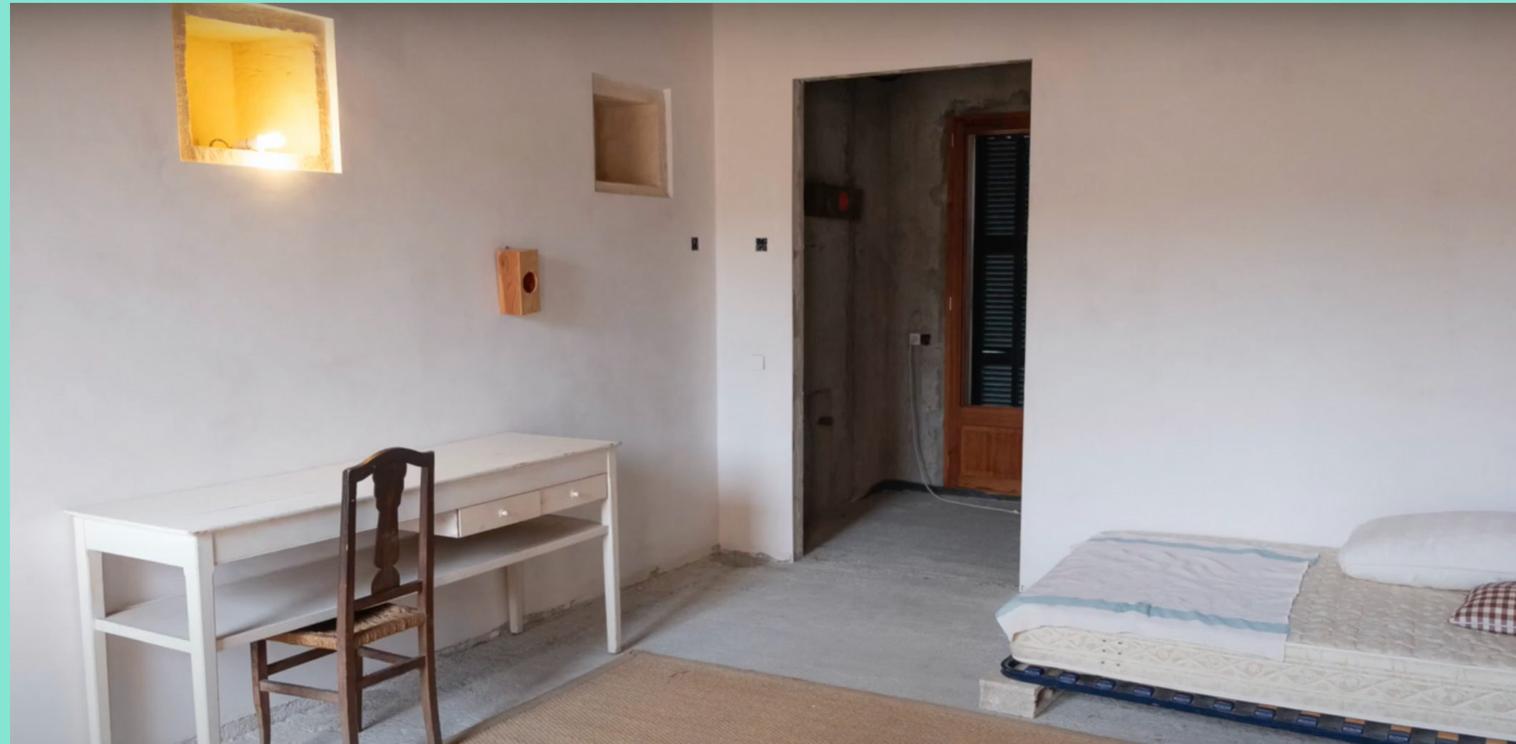
Una de les 5 habitacions de Can Timoner