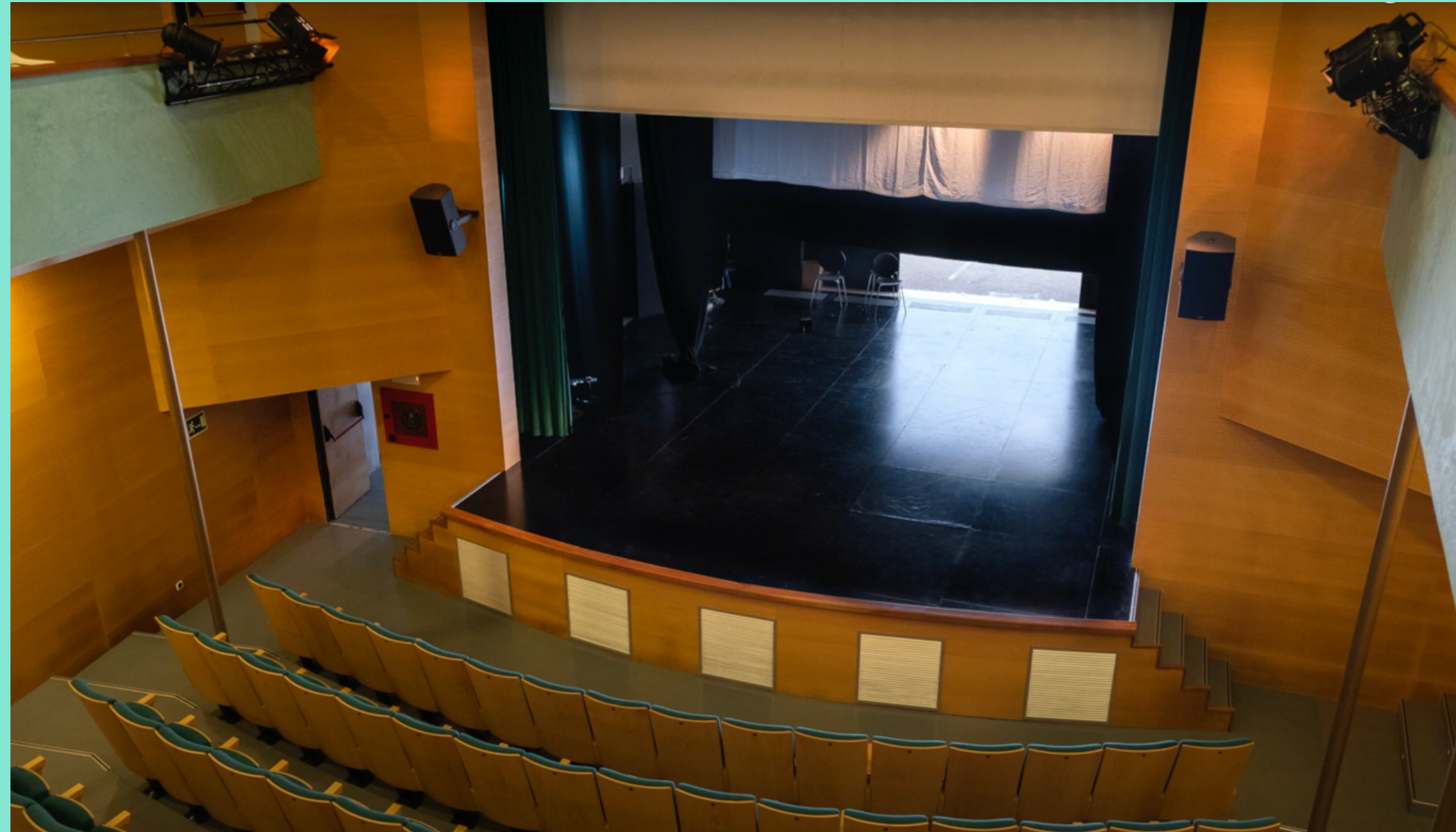
Interior del Teatre Principal de Santanyí