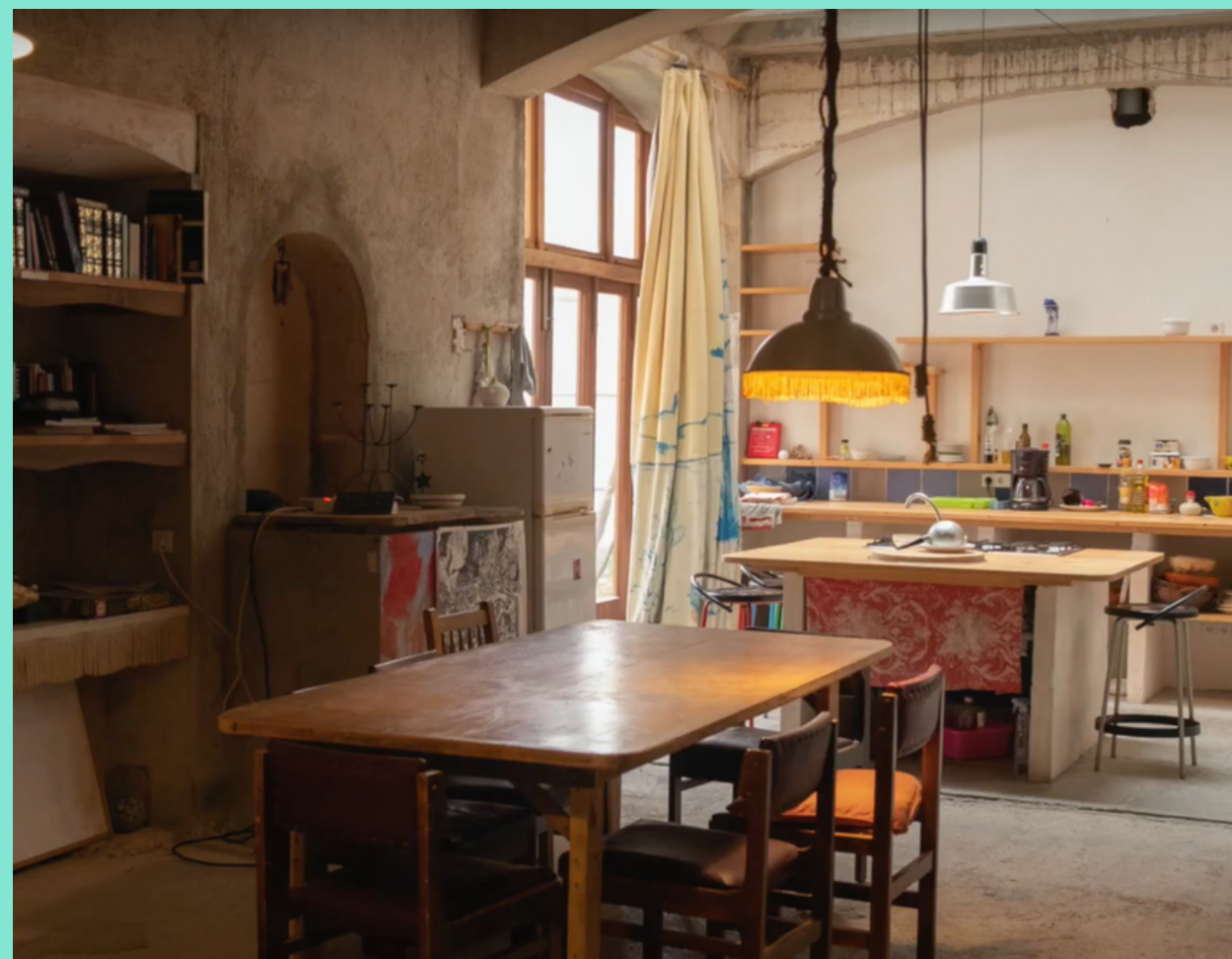
Cuina de Can Timoner

L'espai compta amb 5 habitacions, cuina, dos banys, tres terrasses, diferents espais d'esbarjo i tres sales.