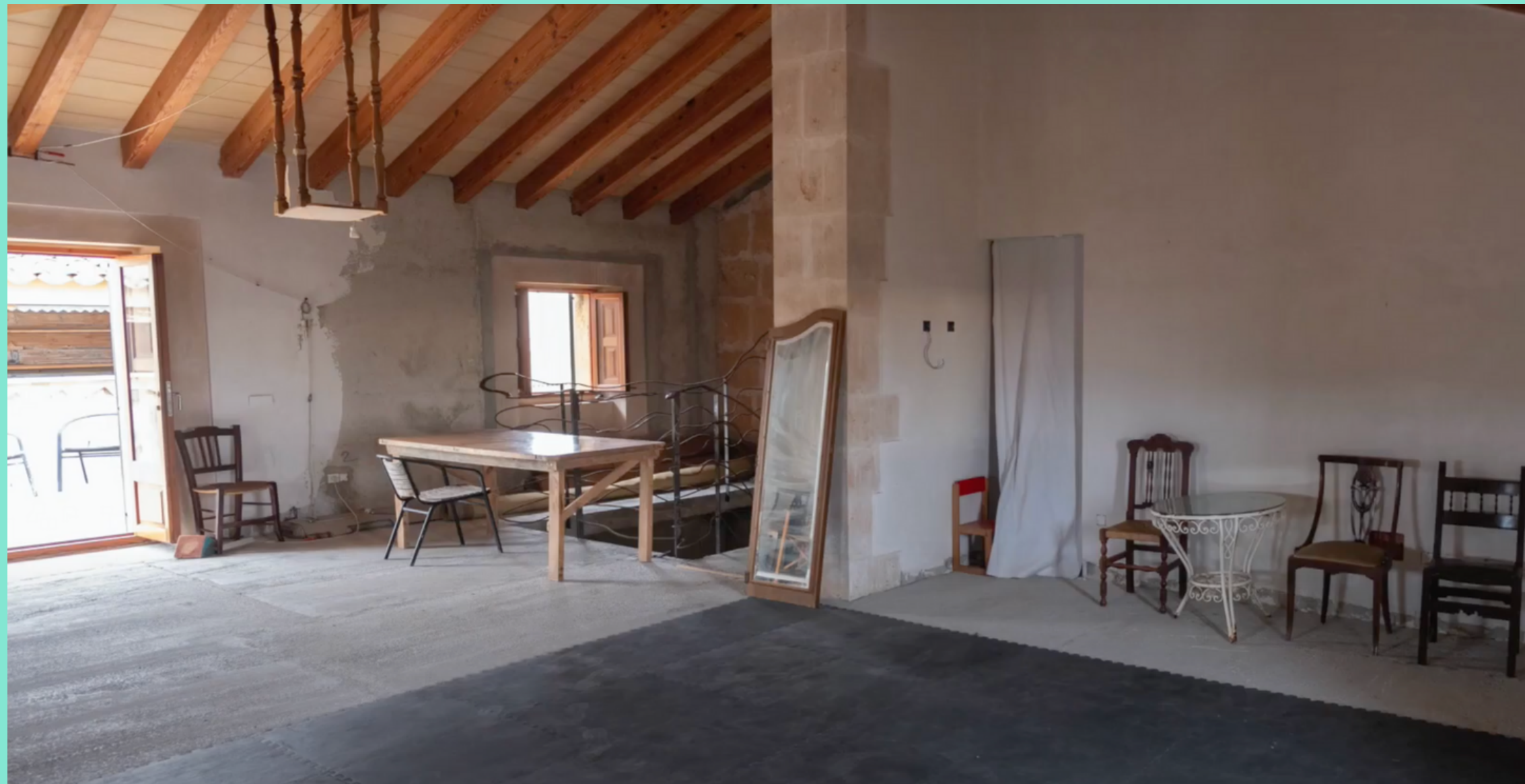
Sala de la tercera planta de Can Timoner