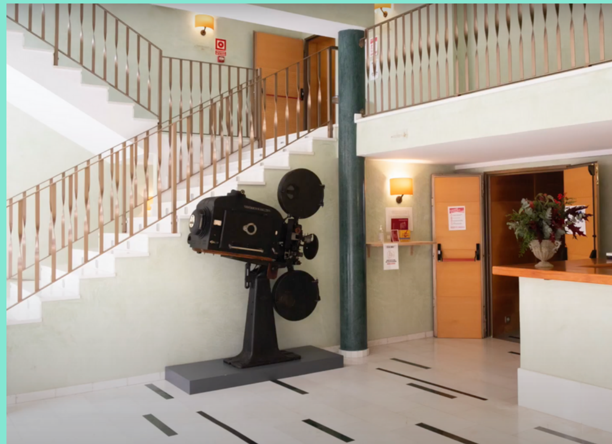
Vestíbul del Teatre Principal de Santanyí